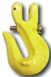
GG met borgpen